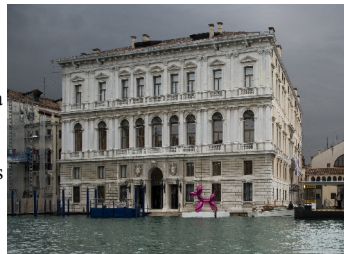
Collection François Pinault