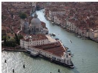
Punta della Dogana Palazzo Grassi