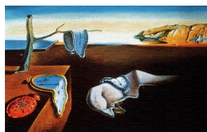
Salvador Dali « Persistance de la mémoire »